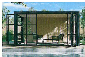
ガーデンルームプラン

プラスGはお庭に素敵な目隠しのシーンを演出し たりガーデンルームを作ったり。自由な発想と組み 合わせて憧れの空間を作ることが出来る商品です。