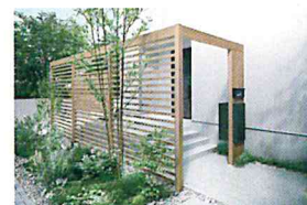
アプローチプラン