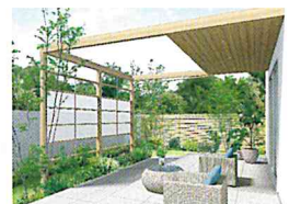
ガーデン目隠しプラン