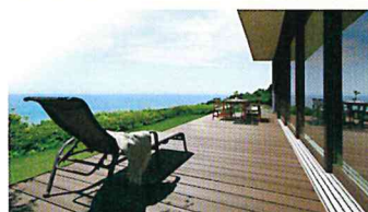
樹ら楽ステージ木彫